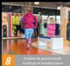
8 Probeer de geschikte wandelschoen uit van verschillende merken