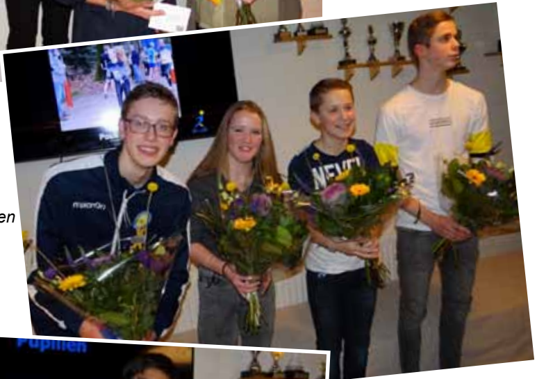
De genomineerden voor de Frans Smits Bokaal 2018.