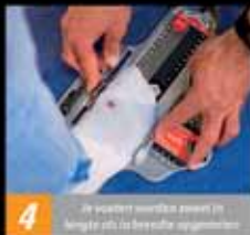
4 Je wandel worden eerst in de loopband op de juiste snelheid opgenomen