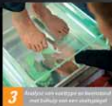
3 Analyse van voettype op een mat met drukpunten met behulp van een voetspiegel