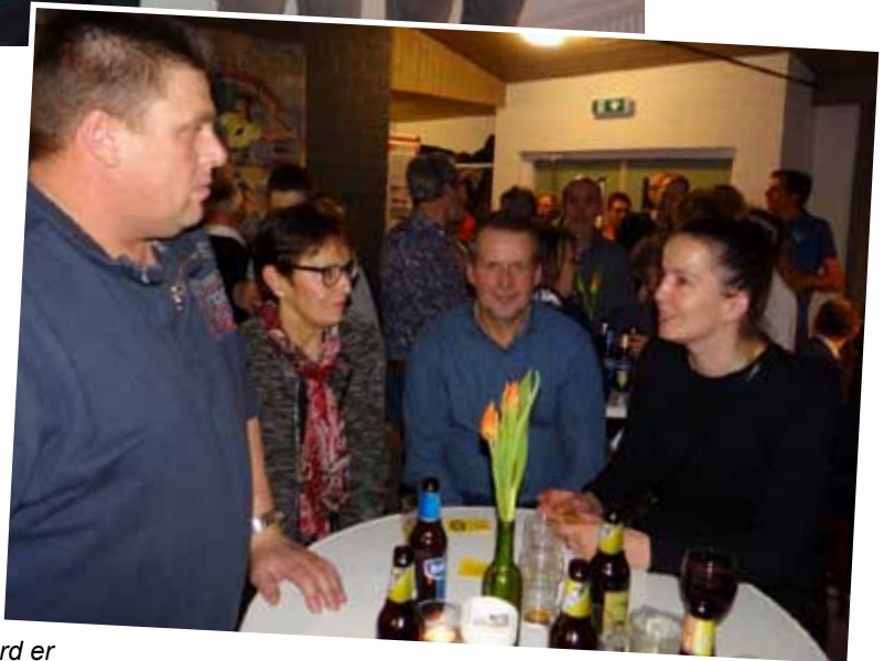
Na afloop werd er onder de aanwezigen gezellig nagepraat en geborrelt.