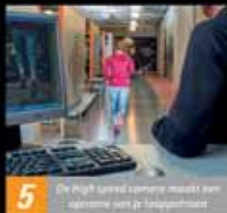
5 De high speed camera maakt een opname van je loopstap