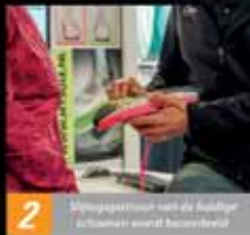
2 Voetmeten met de laatste technieken wordt aanbevolen