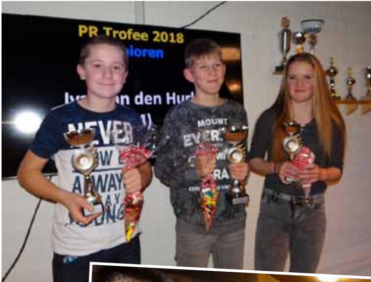
De nummers 1, 2 en 3 bij de PR-trofee voor de junioren.