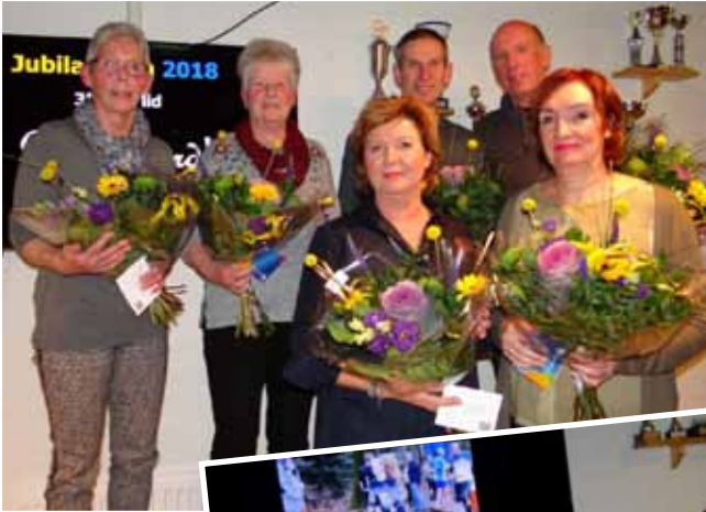
De 35-jarige jubilarissen van AV-LGD.