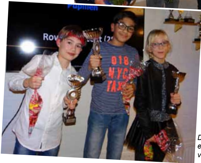
De nummers 1, 2 en 3 bij de PR-trofee voor de pupillen.