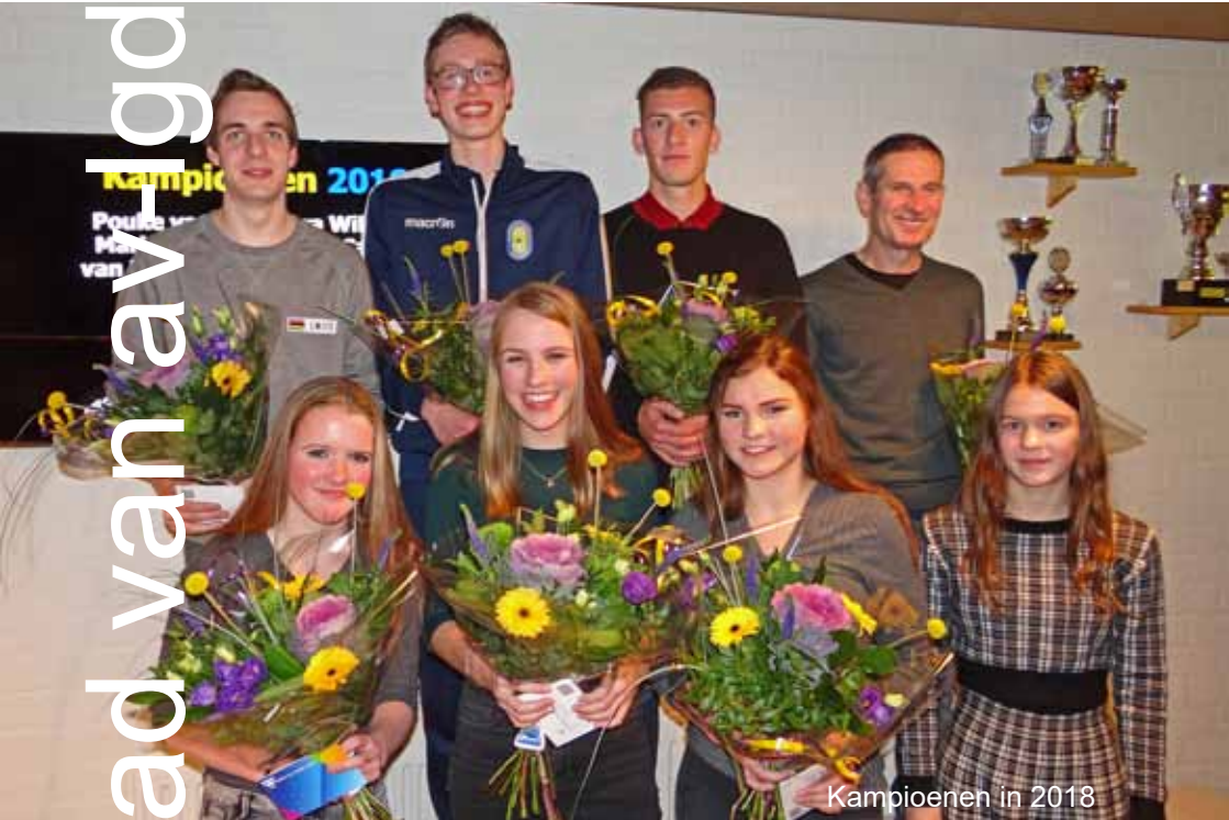
Kampioenen in 2018