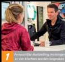
1 Persoonlijk advies, massage en een 30minuut wandeltest

Ons persoonlijk en merkonafhankelijk schoenadvies komt tot stand via de onderstaande werkwijze en is gratis bij aankoop van schoenen: