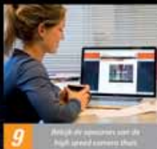
9 Proef je schoenen aan de high speed camera thuis