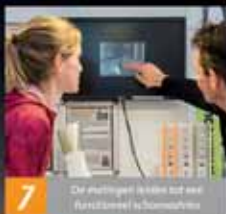
7 De hartslag wordt tot een hardlooptest toegevoegd