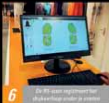
6 De PC aan rechtlijgt het stappenloop onder je voeten