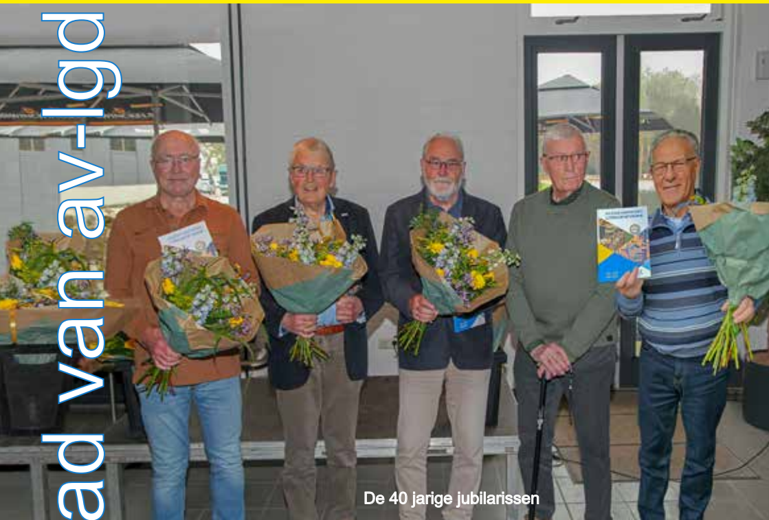
De 40 jarige jubilarissen